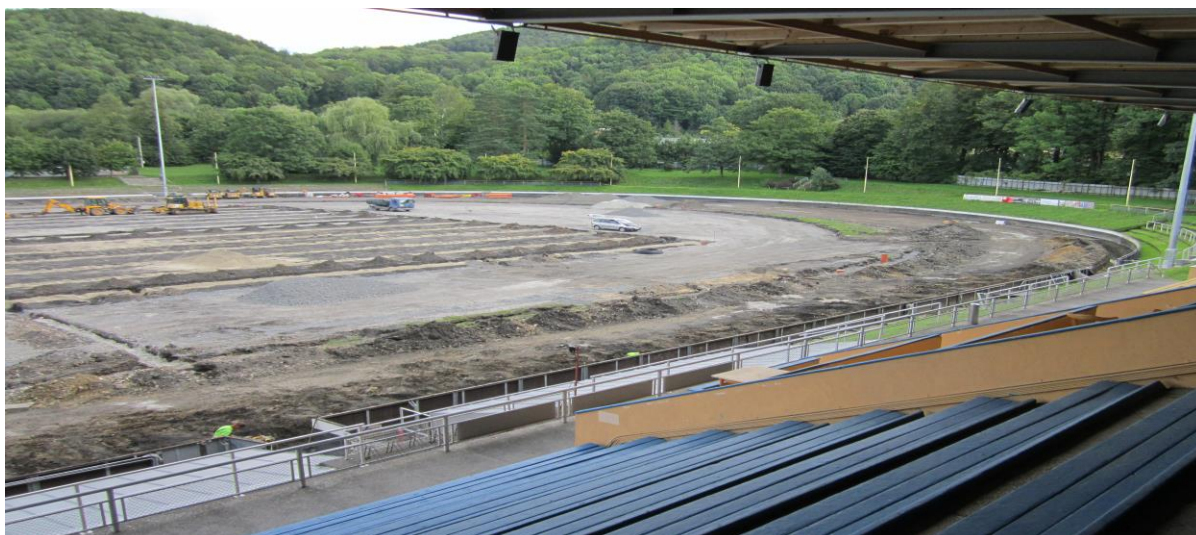
Rekonstrukce hlavní plochy Letního stadionu