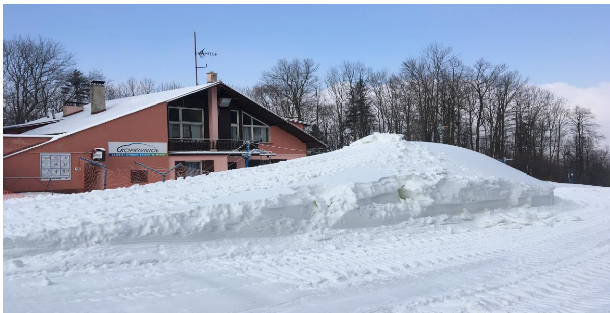
vyrobený sníh po noční směně

Pokud má areál přilákat větší množství lyžařů a má se stát ekonomicky udržitelným je NUTNÉ alespoň: