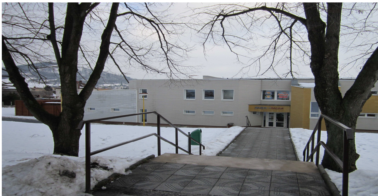
Krytý bazén – příchod od parkoviště

V roce 2017 byla prováděna běžná údržba a opravy zařízení. V letní odstavce byla provedena střední oprava ozonizátoru Poolactiv, přespárování bazénových van, výměna obložení, lavic a dveří původní finské sauny, opravy klimatizace a další řada běžných provozních oprav.