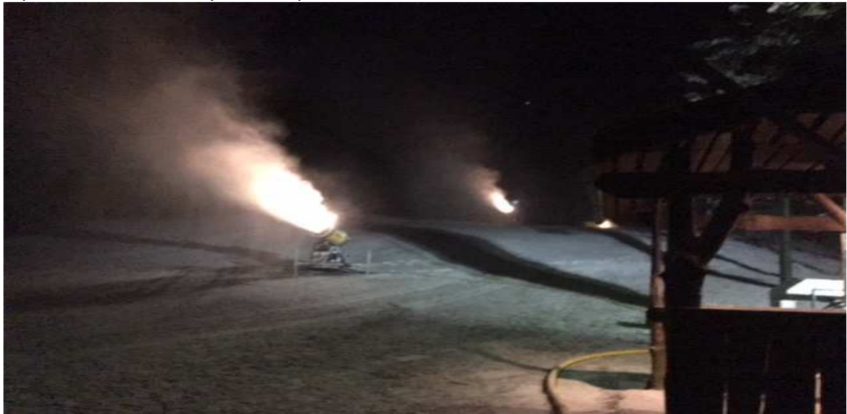
Sněžná děla při výrobě sněhu pracují především v nočních hodinách

V roce 2017 bylo středisko v provozu od 14.01.2017 do 29.2.2017. Abychom mohli hovořit o úspěšné sezoně, musí být areál v provozu cca 90 dnů.